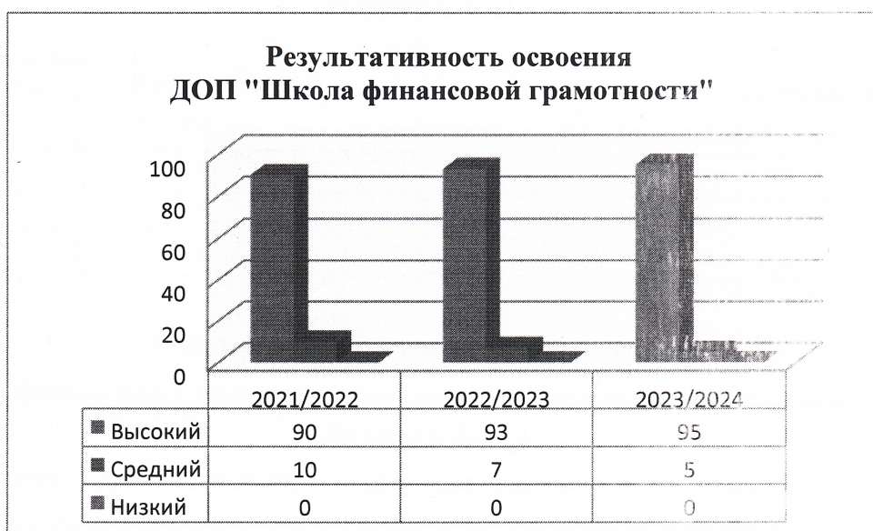
Рисунок 1. Сравнительный анализ качества овладения учащимися ЗУН за три года

Важным критерием оценки эффективности деятельности объединения и качественных характеристик образовательного процесса, осуществляемого в рамках реализации дополнительной общеразвивающей программы, являются показатели овладения учащимися знаний, умений и навыков по трем уровням: высокий, средний, низкий (рисунок 1).